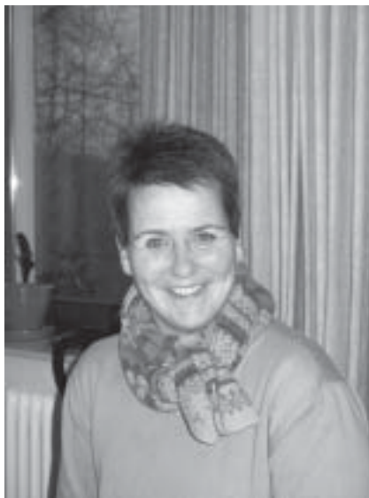
Neue Leitung mit freundlichem Wesen

Ich bin neugierig. Nein, mit Nachbarn und so hat das nichts zu tun. Die Sesamstraße mit ihrem Slogan „wieso, weshalb, warum - wer nicht fragt bleibt dumm hat es gut beschrieben. Ich bin jemand, der fragt, der probiert, der will selber machen ( so werden die Hürden des Computers selbst bei mir immer niedriger ) und dieses möchte ich auch den