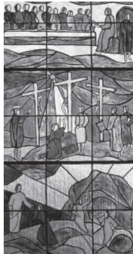
Das Osterfenster im Haus der Begegnung - vom Diakon Paul-Gerhard Hecker 1996 gestaltet

Die Trauer ist ja nicht mit einem Schlag ausgelöscht. Aber wenn man sie zulässt, kann die Hoffnung anfangen zu keimen, dass einmal Trauer und Schmerz endgültig überwunden sein werden. Das ist doch unsere Hoffnung!