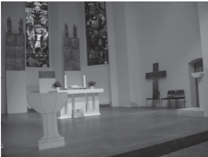
Modell in Originalgröße: Im Vordergrund die Taufe, dahinter der Altar. Das Fleerkreuz wird eventuell seinen Platz in der Nische des Chorraumes finden.

Eine weitere Frage war, wie sich der Gottesdienst und ein in der Kirche etabliertes Kulturangebot verbinden ließen. Muss man