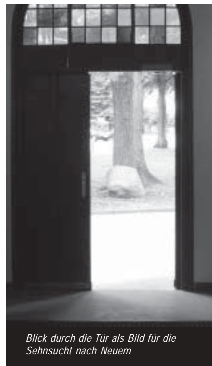
Blick durch die Tür als Bild für die Sehnsucht nach Neuem

Da begriffen sie, der Ort, wo Himmel und Erde sich berühren, befindet sich an dem Ort, den Gott uns zugewiesen hat.