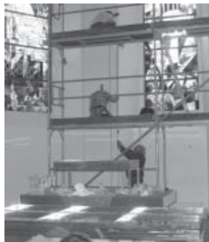
Letzte Hand wurde angelegt: Die Installation der Heidrieder-Altarplatten