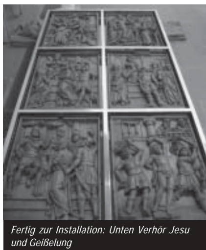
Fertig zur Installation: Unten Verhör Jesu und Geißelung

Der Altar „wächst aus dem Boden“, so der Künstler. Vorne ist ein Stück unbehaueener Stein zu sehen. Er soll an Petrus erinnern, den Jesus als Fels bezeichnet hat, auf dem