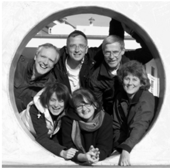
Die Sängerinnen und Sänger der Gruppe „a capriccio“