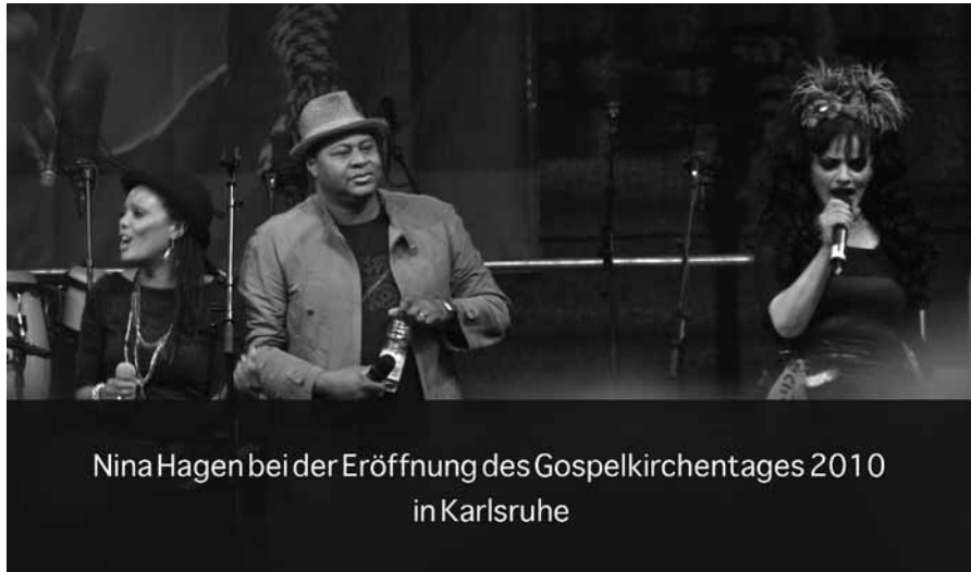
Nina Hagen bei der Eröffnung des Gospelskirchentages 2010 in Karlsruhe