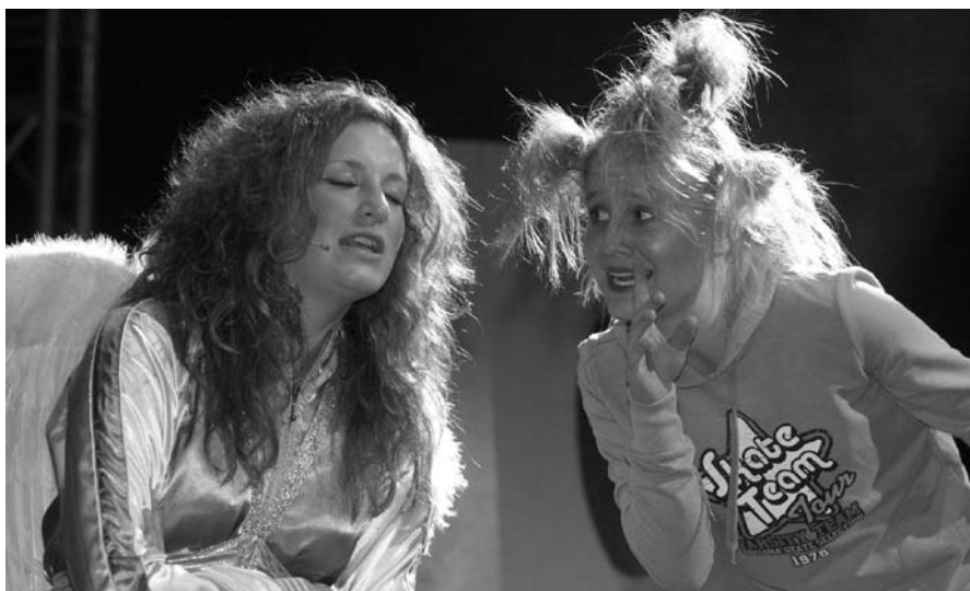
Der Engel und die Hirten - „Bethlehem '82“ auf der Bühne