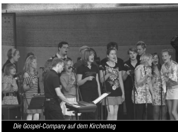
Die Gospel-Company auf dem Kirchentag

Das Chörchen und der Jugendchor Oldesloe erlebten vor kurzem einen begeisternden Workshop mit der Soul- und Gospelsängerin Love Newkirk. Die Amerikanerin war nach Oldesloe gekommen, um die nahezu 150 Sängerinnen