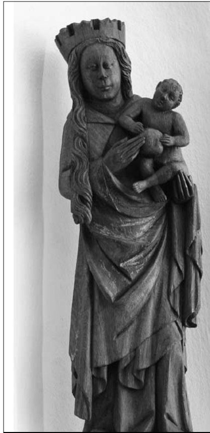
Tralauer Madonna mit Kind, etwa 15.Jahrh.