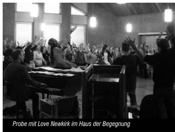
Probe mit Love Newkirk im Haus der Begegnung

sucher!) eine umjubelte Aufführung im Treffpunkt Musiktheater. Die gute Ausstattung eines professionellen Theaters, sowie der Aufwand eine Band, den Tontechniker und Lichttechniker mitzubringen, sowie die intensive Vorbereitung hatten sich gelohnt. Kirchentag 2009: ein großer Erfolg.