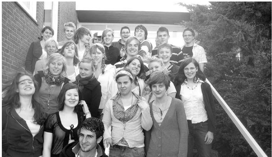
Teamer vor dem Haus der Begegnung

Nach der Konfirmation gibt es in unserer Kirchengemeinde das Angebot der Teamerausbildung. Wer sich dort anmeldet, lernt bei den wöchentlichen Treffen wie man Kinder- und Jugendgruppen leitet, Freizeiten organisiert, Konfirmandenunterricht gestaltet und bei Andachten und Gottesdiensten mitwirkt. Um nach der insgesamt einjährigen Schulung auch die Jugendleitercard (JuLeiCa= bundesweit gelten-