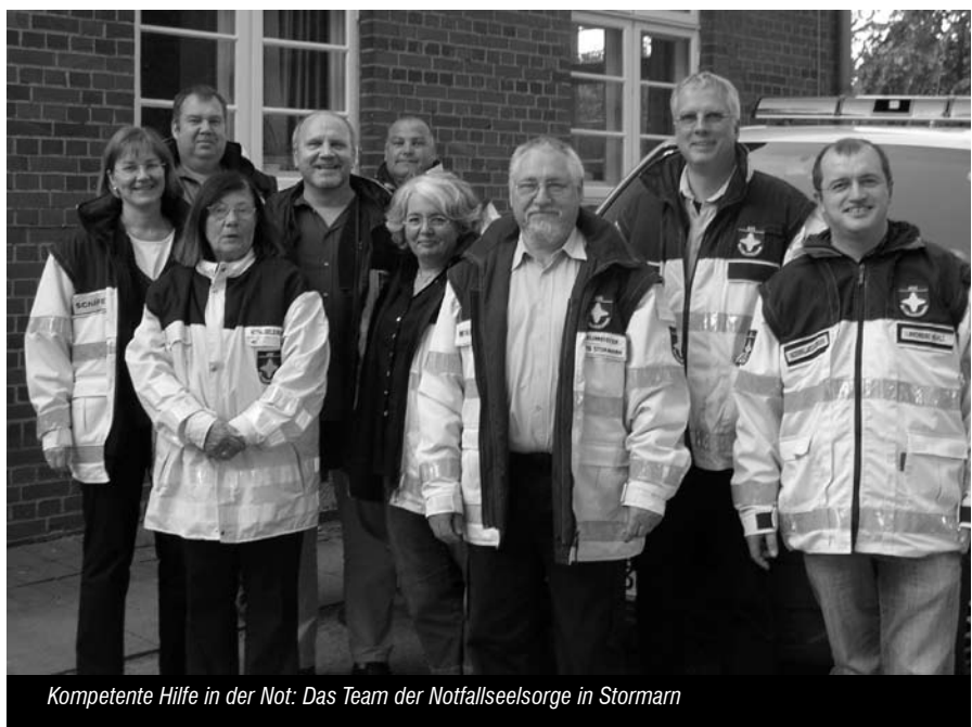
Kompetente Hilfe in der Not: Das Team der Notfallseelsorge in Stormarn