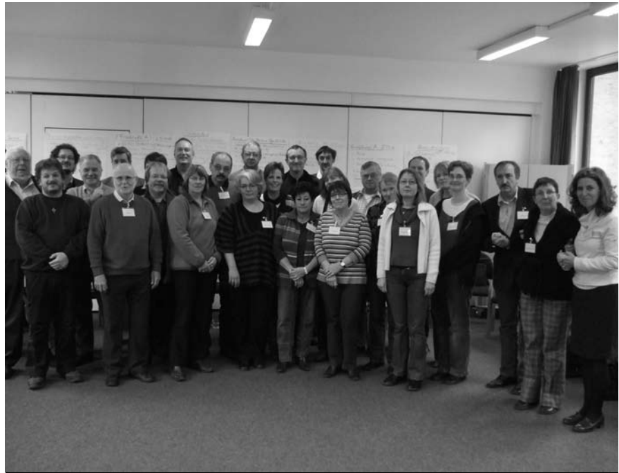
Gruppenbild des neuen Kirchenvorstand während einer Arbeitspause

Der Kirchenvorstand ist für die Verwaltung und Leitung der Kirchengemeinde Oldesloe – mit über 16.000 Gemeindemitgliedern die größte Kirchengemeinde im neu gebildeten Kirchenkreis Plön-Segeberg – verantwortlich.