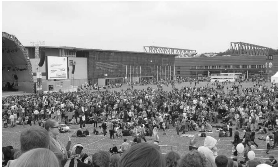
Impressionen vom 32. Evangelischen Kirchentag in Bremen

Die Reise begann am 20.05. um 13:27h vom Bahnhof in Bad Oldesloe. Mit einer Gruppe von 7 Leuten machten wir uns auf den Weg zur freundlichen Übernahme der Hansestadt Bremen durch mehr als 100.000 Christen aus aller Welt. Untergekommen sind wir in der Finndorfschule in Osterholz- Scharmbeck. Betreut durch die Gemeinde der Klosterkirche St. Marien, die sich sowohl in der Schule beim Frühstück, als auch am Abend im Gute- Nacht- Kaffee sehr gut um unser körperliches als auch geistiges Wohl gekümmert habe, allen Beteiligten dieser Gemeinde sei an dieser Stelle nochmal besonders gedankt. Schon der Mittwochabend zeigte, wie groß das Interesse am Kirchentag auch in diesem Jahr wieder ist. Ein Eröffnungsgottesdienst mit gut 60.000 Menschen auf der Bremer Bürgerweide läutete den Abend der Begegnung in der Bremer Innenstadt ein, der nur kurz durch die Niederlage Werder Bremens im UEFA- Cup getrübt wurde, interessant wie unwichtig Fußball auf einmal werden kann! Trotz der vielen Menschen muss an dieser Stelle ein Lob an die Bremer Verkehrsbetriebe und die Deutsche Bahn ergehen, die auch den größeren Bedarf erstaunlich gut im Griff hatten, von kleinen Ausnahmen einmal abgesehen. So berichtete uns eine Dame auf