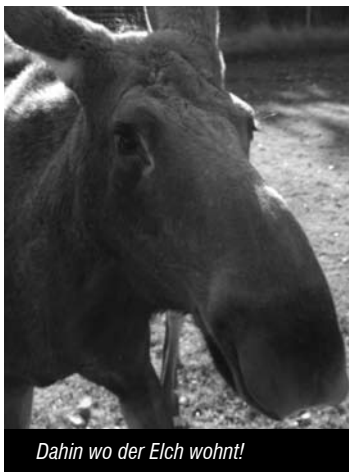
Dahin wo der Elch wohnt!