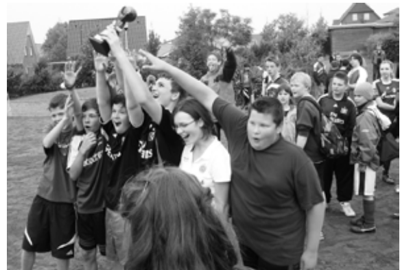
Das siegreiche Team der „Kicker“ mit dem begehrten „Pott“