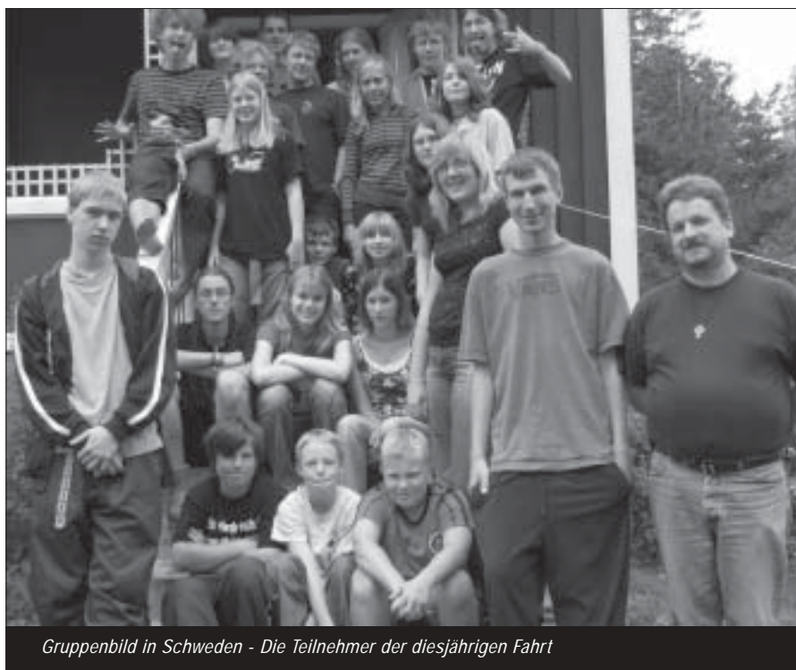
Gruppenbild in Schweden - Die Teilnehmer der diesjährigen Fahrt