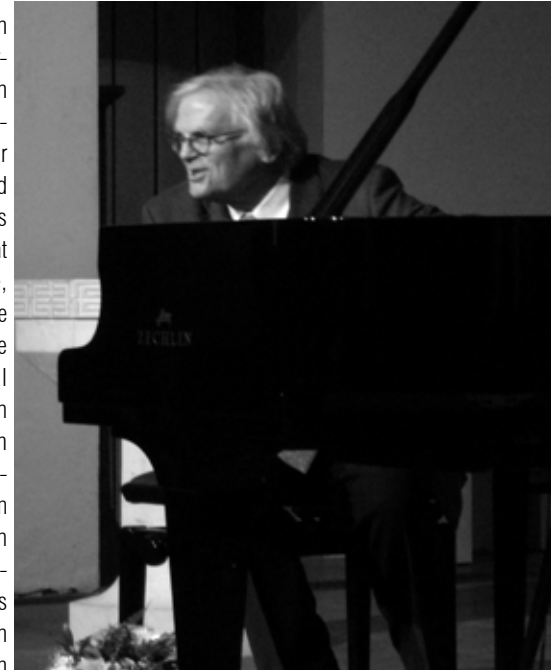
Professor Justus Frantz am Steinway-Flügel

Nach der Pause schilderte Frantz Mozarts Situation in Paris. Der Erfolg und das Geld blieben zunächst aus, Mozarts Mutter starb und der Musiker blieb fern von der Heimat sich selbst überlassen. „Immer wenn er Erfolg haben will, schreibt er etwas Türkisches.“ So entstand laut Justus Frantz die Sonate A-Dur KV 331 „alla Turca“. Der erste Satz gehört zu den Worten „Freu dich mein Herz, leb deinen Schmerz“, mit dem die Ambivalenz zwischen niederdrückenden und freudigen Gefühlen ausgedrückt werden soll. Den zweiten Satz beschrieb Frantz als „eines der größten Menuette der Musikgeschichte“. Umso bedauerlicher, dass die Besucher des Konzerts durch ein Versehen diesen Teil nicht zu hören