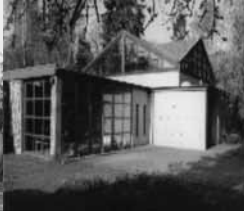
Auferstehungskapelle Bad Oldesloe