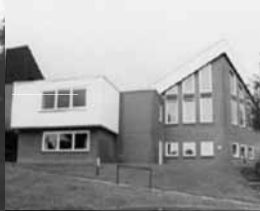
Haus der Begegnung Bad Oldesloe